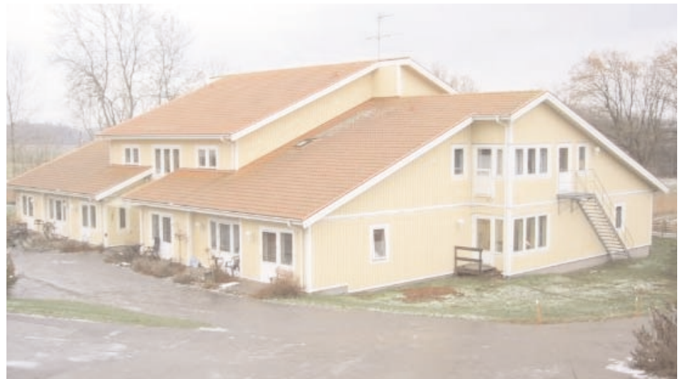
Astagården i Kungsbacka – ett boende för funktionshindrade.

värmepump med tre borrhål. Anläggningen förses med ett energiuppföljningssystem som visar tillförd och avgiven energi för själva anläggningen. På så sätt kan Astagården söka det bidrag som finns för offentliga lokaler.